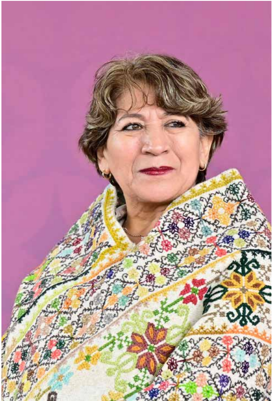
MTRA. DELFINA GÓMEZ ÁLVAREZ GOBERNADORA CONSTITUCIONAL DEL ESTADO LIBRE Y SOBERANO DE MÉXICO.