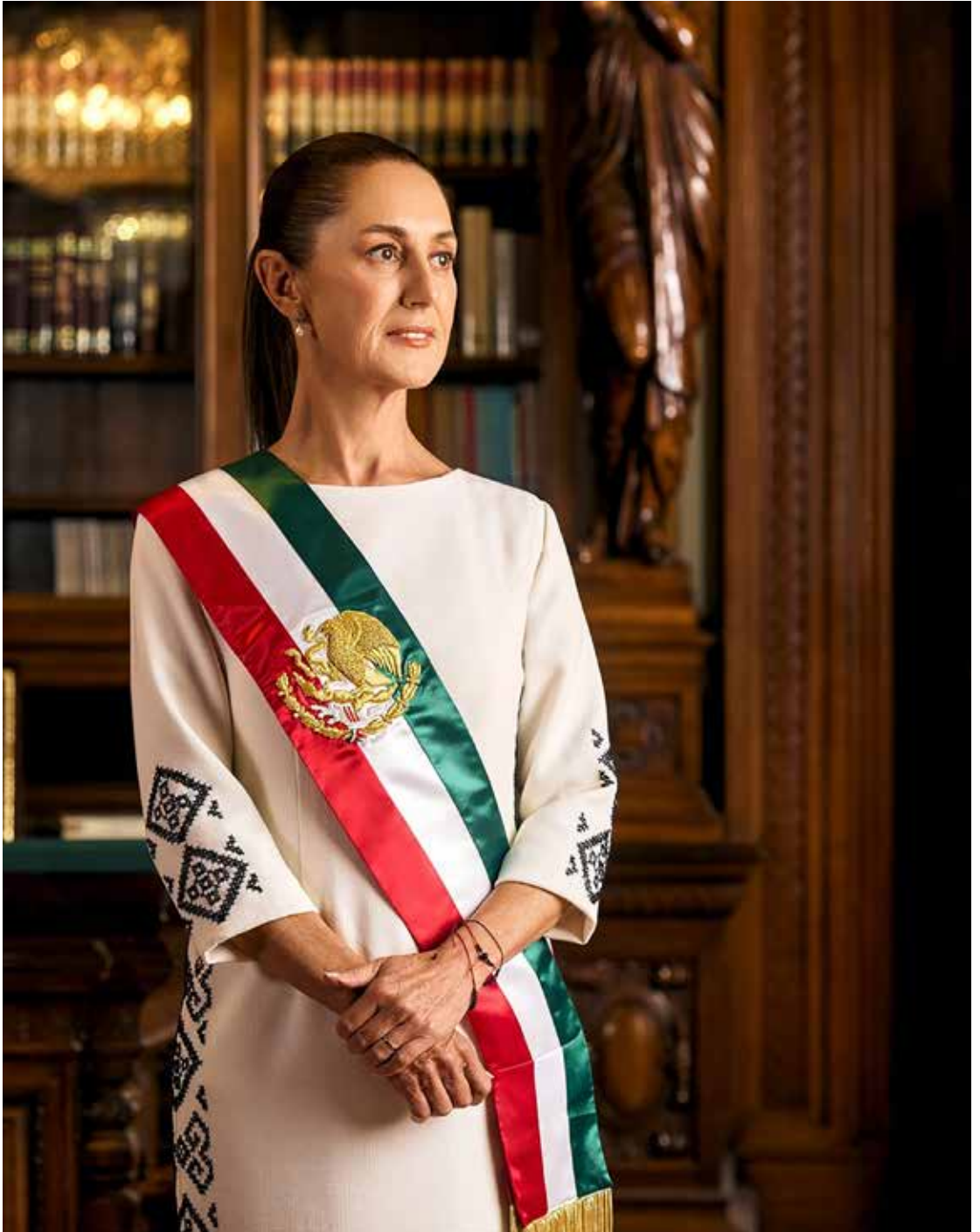
DRA. CLAUDIA SHEINBAUM PARDO PRESIDENTA CONSTITUCIONAL DE LOS ESTADOS UNIDOS MEXICANOS.